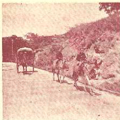
Una salida fuera el picadero