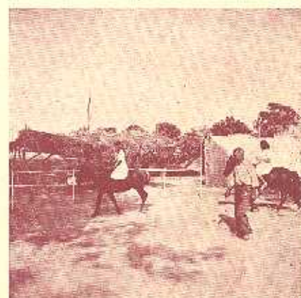
El profesor en guardia