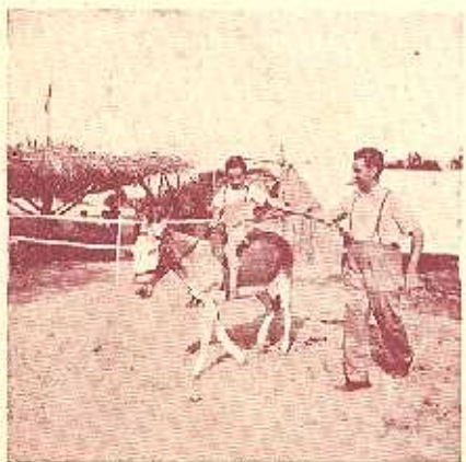
Un papá celoso de su hijo