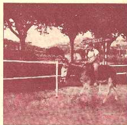
Un pequeño jinete que promete