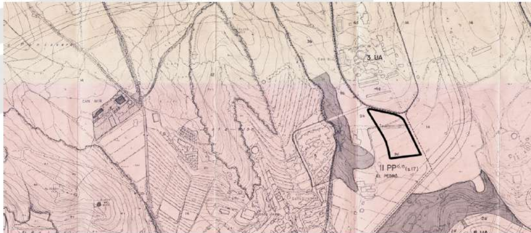
Imatge parcial del plànol núm.3 de les NNSS-1986 amb indicació de la parcel·la objecte.